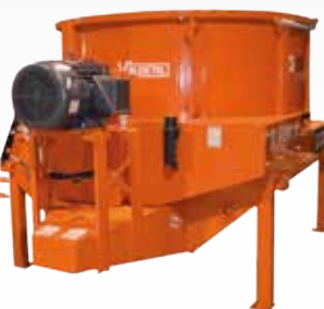
STATIONÄRER ELEKTRISCHER HÄCKSLER