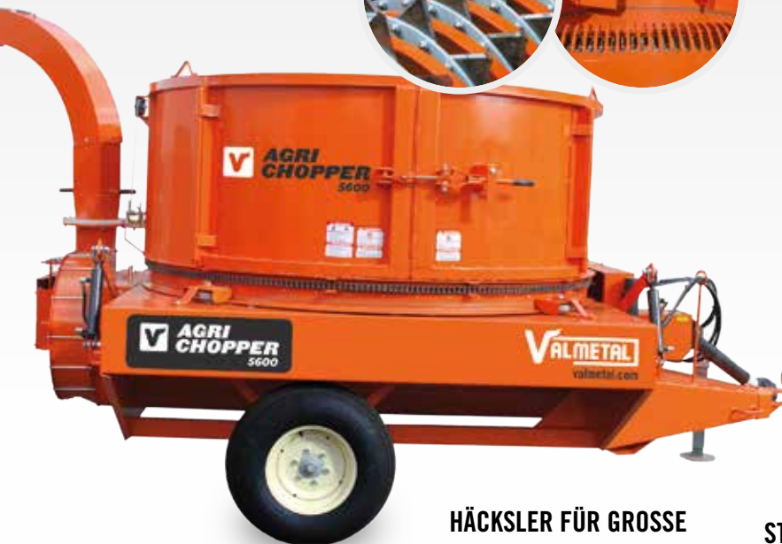
HÄCKSLER FÜR GROSSE BALLE