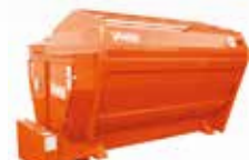
SCHNECKEN MISCHER STATIONÄR