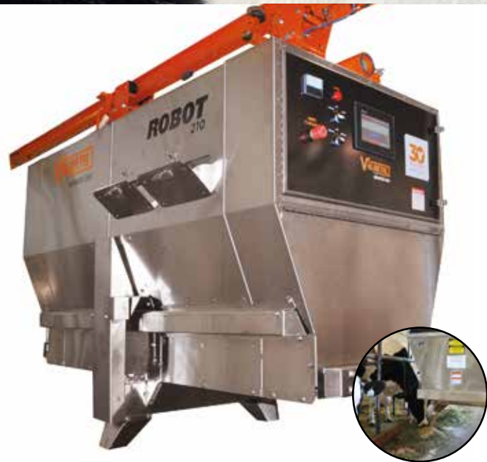
GETREIDE UND KONZENTRAT VERTEILER