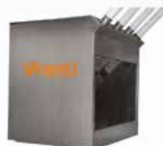
ERGÄNZUNGS- UND MINERAL BEHÄLTER