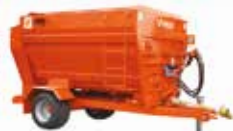
SCHNECKEN MISCHER MOBIL