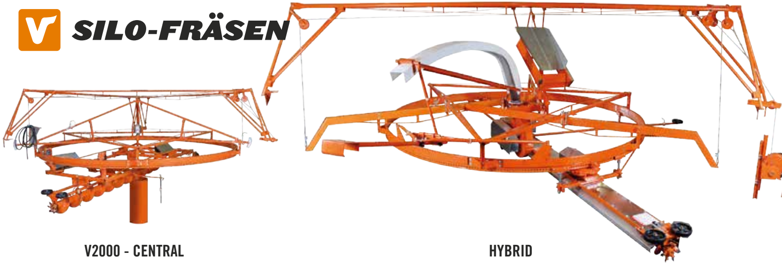
V2000 - CENTRAL